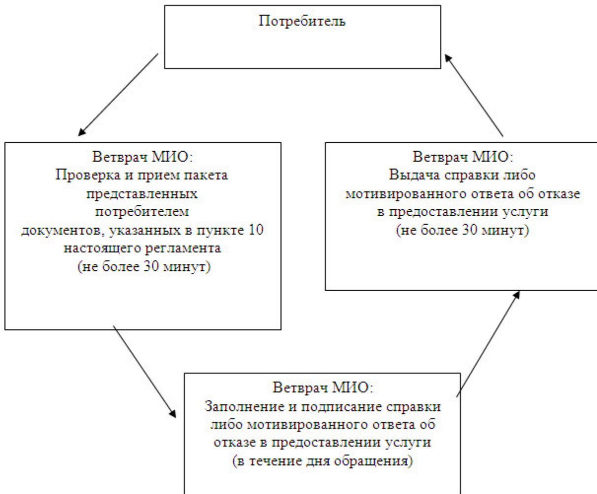
Схема предоставления государственной услуги при обращении в МИО

У т в е р ж д е н о постановлением а к и м а т а К а ч и р с к о г о р а й о н а от 20 ноября 2012 года N 447/16