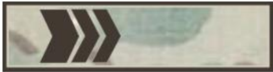
екінші сыныпты сержант