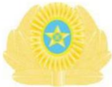
ҰҚК Авиация қызметінің әскери қызметшісі