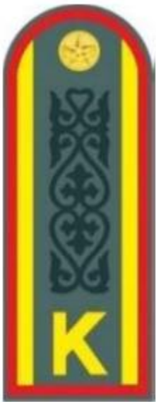
курсанттың пальтосы мен кителіне

Әскери, арнаулы оқу орны курсантының, кадеті мен ұланының (негіз бен көмкерме түсі – әскер тегі бойынша) ПОГОНЫ (136-сурет)