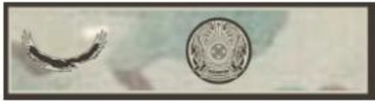
Жоғарғы Бас Қолбасшысы