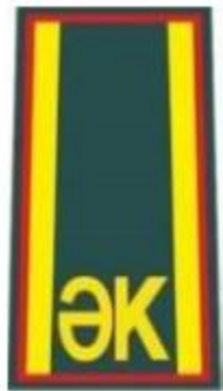
ҚК ӘТК-нің көк түсті нысанды блузасына

Қазақстан Республикасы Президентінің 2025 жылғы 28 қазандағы № 1068 Жарлығына 2-ҚОСЫМША Қазақстан Республикасы Президентінің 2011 жылғы 25 тамыздағы № 144 Жарлығымен БЕКІТІЛГЕН