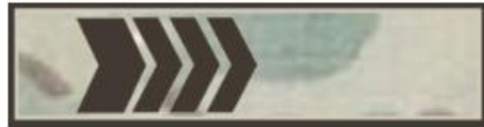
бірінші сыныпты сержант