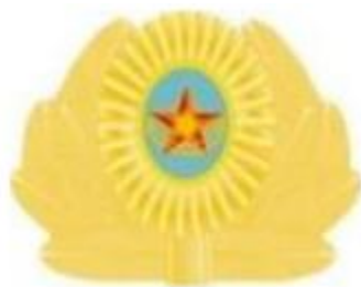
ҚК ӘҚК және ДШӘ

ҚК, басқа да әскерлер мен әскери құралымдар (ҚК ӘҚК-дан, ДШӘ-ден, ӘТК-ден, теңіз жаяу әскерінің бөлімі мен бөлімшесінен, ТЖМ-дан, МКҚ-дан және ҰҚК Авиация қызметінен басқа)