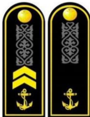
ҚК ӨТК-ның қара түсті пальтосы мен бушлатына