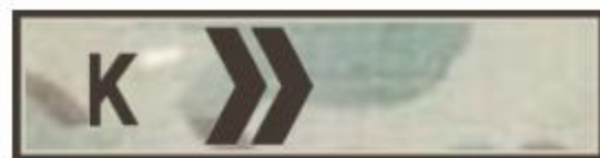
Курсант – кіші сержант