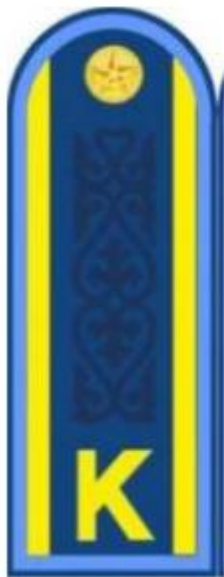
курсанттың пальтосы мен кителіне