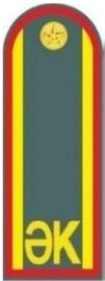
ҚК ӘТК-нің ақ түсті нысанды жейдесіне