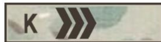
Курсант – сержант