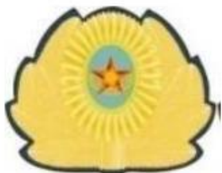
ҚК ӘҚК және ДШӨ

ҚК, басқа да әскерлер мен әскери құралымдар (ҚК ӘҚК-дан, ДШӨ-ден, ӘТК-дан, теңіз жаяу әскерінің бөлімі мен бөлімшесінен, ТЖМ-дан, МКҚ-дан және ҰҚК Авиация қызметінен басқа)