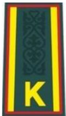
курсанттың күртешесі мен жейдесіне