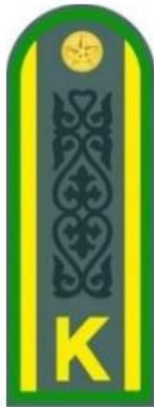
курсанттың пальтосы мен кителіне