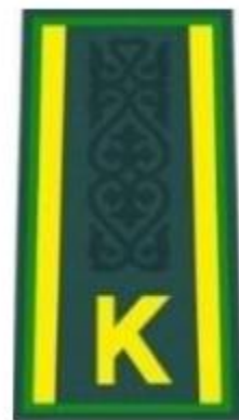
курсанттың күртешесі мен жейдесіне