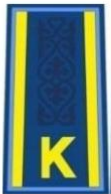
курсанттың күртешесі мен жейдесіне