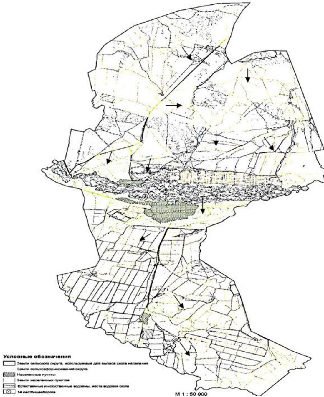
СХЕМА использования пастбищ по Курчумскому сельскому округу (село Курчум, Топтерек, Алгабас)

Күршім ауылдық округі бойынша жайылымдарды басқару және оларды пайдалану жөніндегі 2023-2024 жылдарға арналған жоспарға 7 қосымша