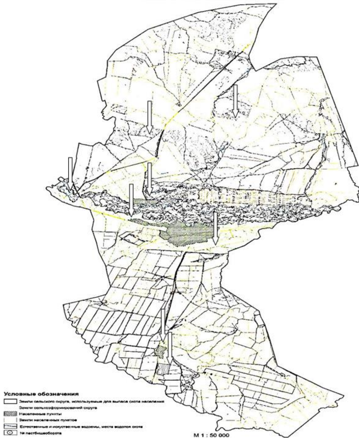
СХЕМА использования пастбищ по Курчумскому сельскому округу (село Курчум, Топтерек, Алгабас)

Күршім ауылдық округі бойынша жайылымдарды басқару және оларды пайдалану жөніндегі 2023-2024 жылдарға арналған жоспарға 5 қосымша